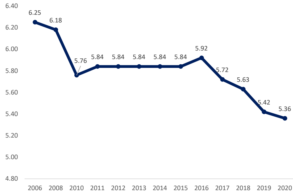
Índice de democracia